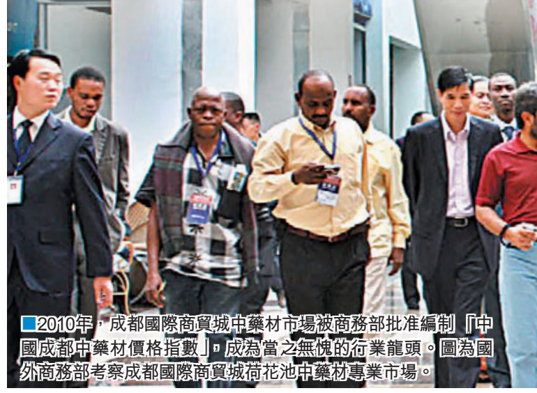
2010年，成都國際商貿城中藥材市場被商務部批准編制「中國成藥中藥材價格指數」，成為當之無愧的行業龍頭。圖為商務部考察成都國際商貿城荷花池中藥材專業市場。

在這一裡，集結了80多個國際一線品牌的仁恆置地廣場隆重開業，來自新加坡的管理團隊將超過18個國際品牌的旗艦店設置其中，超過20個國際一線品牌首次在中國西部亮相。至此，成都已擁有國際一線品牌163個，高檔消費品的銷售量和品位雙雙位居西部之首，全國前列。