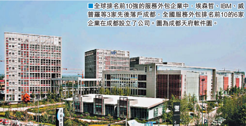
全球排名前10強的服務外包企業中，埃森哲、IBM、威普羅等3家先後落戶成都，全國服務外包排名前10的6家企業在成都設立了公司。圖為成都天府軟件園。