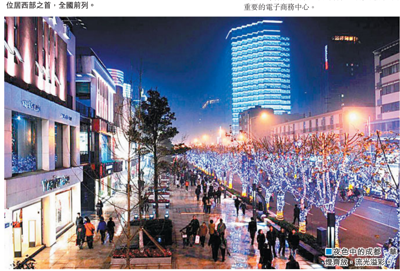
夜色中的成都，輝煌綻放，流光溢彩。