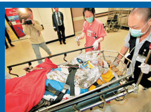
■墮山骨折男子折騰6小時才抵院接受治理。

救援人員接報兵分兩路，部分消防員沿行山路線登山，但因勢偏險及山澗難走，花逾2小時始抵達現場。另外飛行服務隊直升機也奉召到場協助，運載民安隊員