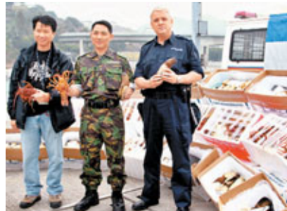
■水警展示行動中檢獲的龍蝦及象拔蚌。

香港文匯報訊(記者 溫瑞麟)水警昨晨在屯門展開反走私行動，期間發現有私梟利用街渡作掩飾，將一批高價海鮮卸落快艇，準備走私返內地，當場檢獲價值76萬元的龍蝦及象拔蚌，事件中約7至8名私梟逃去，無人被捕，案件已轉交海關跟進。警方相信內地對高價海鮮需求量大，故近期走私海鮮活動頻繁，會加強堵截打擊。