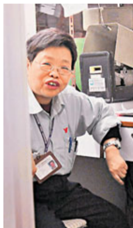
■遭怪賊指嚇打劫的漁灣邨停車場女收銀員。

不敢輕舉妄動，暗中利用無線電通訊機向同事求救，大隊警員接報趕到，當場將該名滿身酒氣怪賊拘捕，女職員幸無受傷，停車場收費亭亦無財物損失。