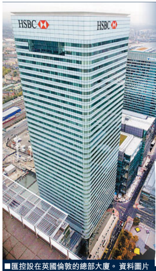
匯控設在英國倫敦的總部大廈。