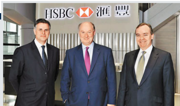
左起：匯控集團財務董事麥榮恩、集團主席范智廉、集團行政總裁歐智華。

香港文匯報訊(記者 馬子豪)對於匯控擬將總部遷回香港的報道，匯豐香港發言人回應本報查詢時表示，該行主席范智廉及行政總裁歐智華早前在業績報告已指出，倫敦將繼續廣泛被認為世界領先的國際金融中心，傾向將總部留於倫敦。雖然目前當地的監管制度變化，以及額外的稅務成本，令越來越多股東質疑將總部設在英國，會否增加該行的營運成本；但該行強調其對倫敦金融城競爭地位的重要性，其貢獻亦得到英國政府的認同。目前對其遷移總部的報道為不確定及冒昧的。