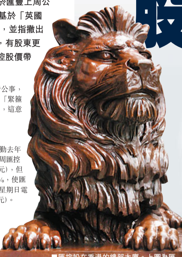
匯控設在香港的總部大廈。上圖為匯豐標誌獅子像。資料圖片