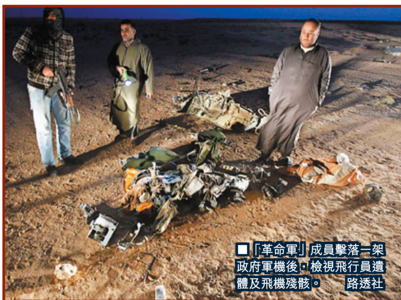
「革命軍」成員擊落一架政府軍機後，檢視飛行員遺體及飛機殘骸。