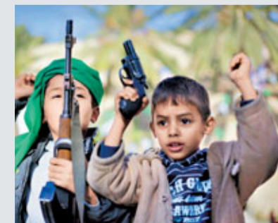
政府軍中有未成年的兒童。

報道指，反對派高層要被捕特種兵向英國首相卡梅倫傳話，警告後者若有意與反對派展開對話，就必須先承認他們是利比亞合法領導人。據悉，該批特種兵和外交官接受問話後，有望於24小時內獲釋。反對派消息稱，英國政府高層正與他們洽商釋放被捕士兵。■《星期日泰晤士報》/《星期日電訊報》/法新社/路透社