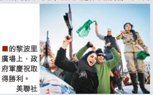
的黎波里廣場上，政府軍慶祝取得勝利。

利比亞軍事衝突持續，「革命軍」昨日試圖進攻領導人卡扎菲的家鄉蘇爾特，但遭政府軍伏擊，被迫撤回距首都的黎波里以東660公里的油港拉斯拉夫，其間1名法國記者中槍受傷。在的黎