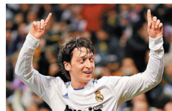
德國小將奧斯爾是皇馬的中場發電機。

皇馬上週主場大炒馬拉加7:0,但入了3球的C朗因傷要缺陣15天,加上前鋒希古恩仍要避戰,儘管射手賓施馬狀態不俗,然而在球隊今季聯賽作客7勝4和2負只入18球下,始終會加重入球的壓力。另外在防中基迪拉已養傷下,昨日又宣布大腿有傷的中場卡卡缺陣,副選防中加高練習時又拉傷大腿要休