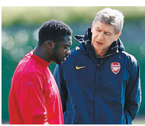
高路托尼(左)曾是雲加麾下愛將。

據新華社4日報道,曼城大將高路托尼因藥檢不合格遭臨時停賽的消息驚動了其昔日在阿仙奴時候的恩師雲加,後者4日透露,高路托尼告訴他藥檢不合格是因為吃減肥藥,雲加亦絕對相信他是清白的。他說:「這絕對是意外,我認識高路托尼多年,他是生活清白的男孩,是個住家男人。」雲加認為,高路托尼只是犯了錯誤,忘記問問他到底能不能吃那些藥,「他只是想控制體重,因為他體重有些問題,然後就吃了他老婆的減肥藥。」