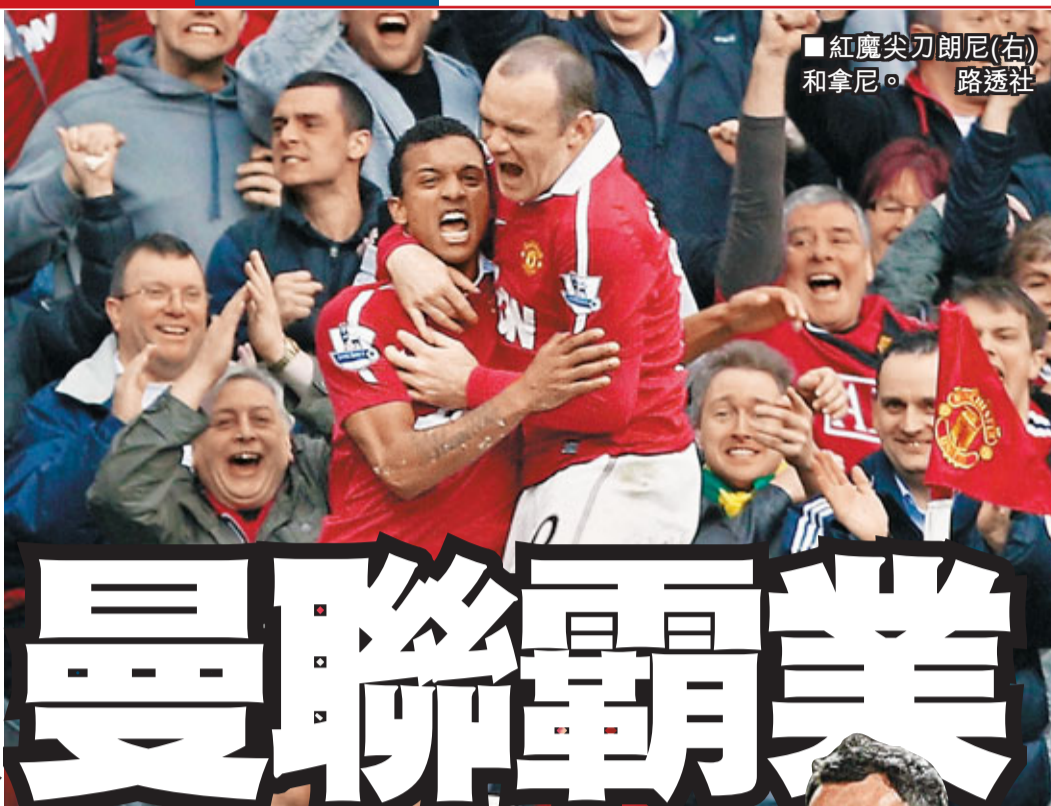
紅魔尖刀朗尼(右)和拿尼。