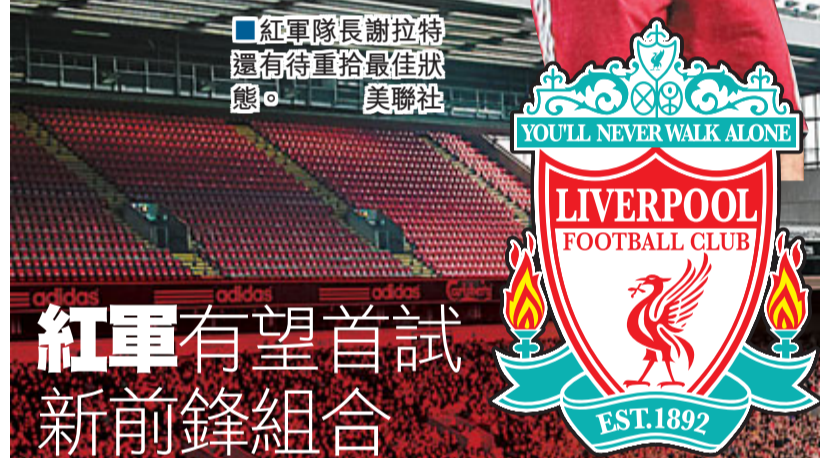
紅軍隊長謝拉特還有待重拾最佳狀態。