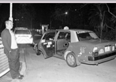
■的士左尾門車窗遭乘客以鐵頭功撞碎,司機大感無奈。

香港文匯報訊(記者 杜法祖)一輛載客的士昨凌晨發生罕見意外,一名醉漢乘的士返家,途至沙田欲伸頭窗外嘔吐,但糊塗問忘記車窗已關上,前額猛撼車窗,玻璃應聲粉碎,事主如練就「鐵頭功」,竟毫無損傷,更如願探頭車外嘔吐,惟因賠償損毀爭拗驚動員到場,調解後雙方和平解決,警員收隊離去。