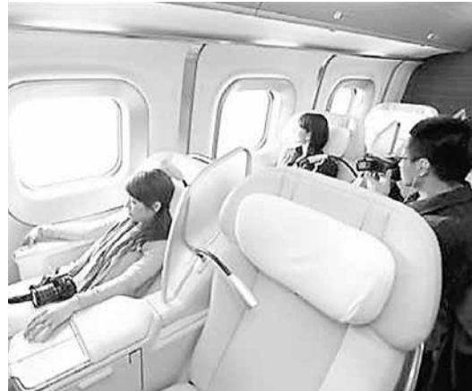
車廂豪華程度媲美飛機商務艙。

日本最新的新幹線子彈火車「隼鳥號」(Hayabusa)昨日通車，其時速300公里，僅次於中國高鐵「和諧號」。日本新幹線是世界主要高鐵技術之一，過往經常輸出海外，但近年面對中、法、德等國激烈競爭，銷美計劃碰壁。除了高鐵，日企近年在多個範疇都面臨中國強大競爭，有日企就計劃與韓企結盟，以防中國「走得太前」。