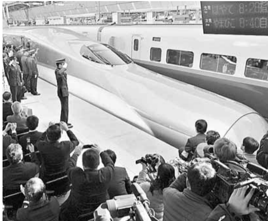
大批記者昨日一睹「隼鳥號」通車。