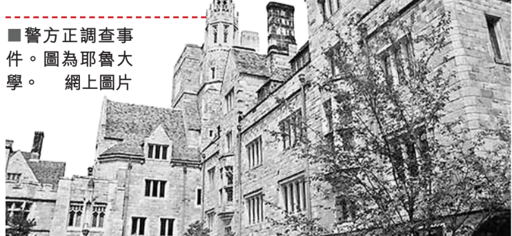
■警方正調查事件。圖為耶魯大學。