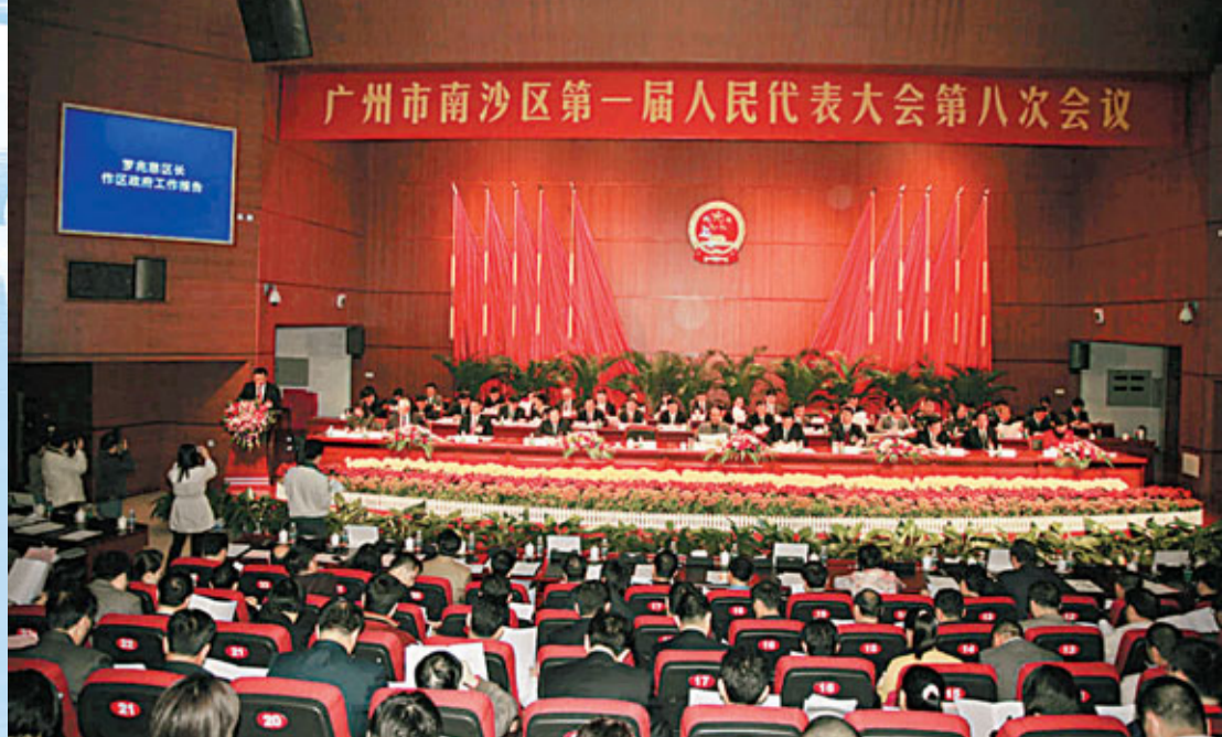
廣州市南沙區一屆人大八次會議隆重開幕

據介紹，南部片區在完善提升十九涌東堤段漁人碼頭傳統旅遊購物餐飲網點的基礎上，拓展十九涌西堤段的旅遊商業帶，並加快相應的道路配套建設，形成人流、車流的良性循環；同時加快完善濕地遊覽區二期建設，形成環濕地的南部大旅遊商貿片區。東部片區，加強與霍英東基金會的合作，以天后宮、濱海泳場、上下橫檔島、遊艇會為依托，推進濱海公園星級酒店、海洋館等項目建設，發展高端會所和旅遊業。北部片區，依托亭角立交便捷的公路和高快速路網絡，通過「三舊」改造，引入知名名牌項目，發展大型商貿、酒店和娛樂業，使其成為「廣州一日遊」的好去處。