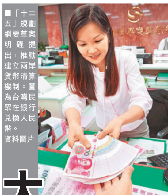
「十二五」規劃綱要草案明確提出，推動建立兩岸貨幣清算機制。圖為台灣民眾在銀行兌換人民幣。資料圖片

兩岸關係專家、廈門大學台灣研究院李非教授指出，在產業合作和區域範疇，兩岸特別是大陸，還需要更有更新、更清晰的發展規劃。「以平板顯示器為例，福建、廣東、江蘇等省份都將此列為重點產業，對接時就可能出現爭搶資源的局面，反而不利於產業整體質素。」李非認為，避免無謂的惡性競爭，實現產業鏈的錯位發展，對於「十二五」期間兩岸產業合作，具現實意義。