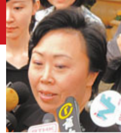
香港運輸及房屋局局長鄭汝樺。

香港文匯報訊(記者 曾偉龍)港深前海西部快速軌道獲納入「十二五」規劃，香港運輸及房屋局局長鄭汝樺(見圖)表示，前海西部快速軌道是多功能鐵路，建成後可結合香港機場及深圳機場的優勢，該項目已進入規劃階段，並已獲得香港立法會撥款，下階段會研究詳細走線、客流等問題。但由於需要配合前海整體發展規劃，該項目暫時未有具體時間表。她表示，目前香港口岸及載客能力不足以服務珠三角