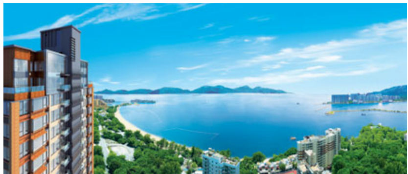
「海譽 Crown by the Sea」位處於著名地標式海灣，全部單位可享高角度壯麗海景，絕非其他區內樓盤所能媲美。

項目的另一焦點為2間頂層複式海景鉅宅「海景天際屋Skyhouse」以及2間連特大平台花園的「花園海景大戶」。