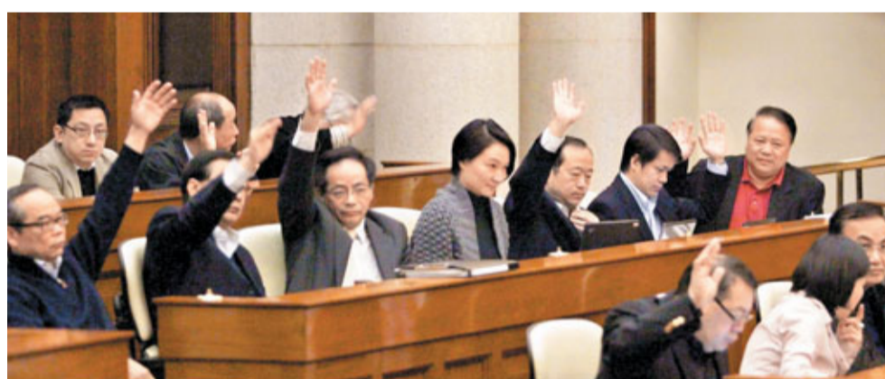
立法會經過一連4日的會議，先後三讀通過2012年特首及立法會兩個選舉條例的修訂草案。

香港文匯報訊(記者 鄭治祖)經過長達4天的馬拉松式辯論，香港立法會終於通過落實明年特區行政長官和立法會選舉的《2010年行政長官選舉(修訂)條例草案》及《2010年立法會選舉(修訂)條例草案》。政制及內地事務局局長林瑞麟表示，立法會是次通過兩條草案，是香港政制發展重要的里程碑，也是重要的分水嶺，而特區政府將於明年中之前，進一步處理兩個選舉附屬法例的工作，包括為配合未來一年多的4場選舉，於稍後向立法會提交處理選舉呈請和上訴機制的條例草案。