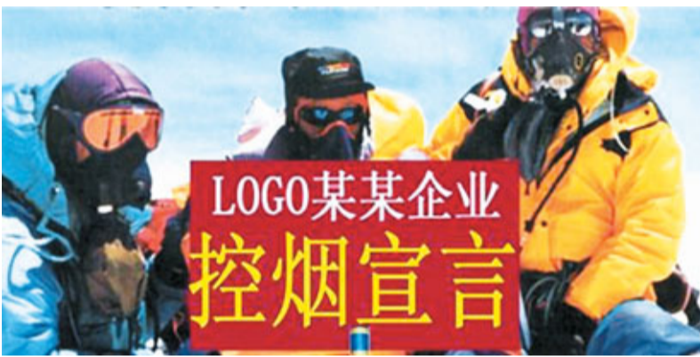
世界最高的廣告牌效果圖。

日前，中國控制吸煙協會決定，「中國控煙宣言」將登上世界第一高峰——珠穆朗瑪峰，成為史上最高的廣告牌，借此表明中國控煙的決心。同時，這塊廣告牌的「企業贊助權」將用拍賣的方式產生，起拍價200萬元人民幣。