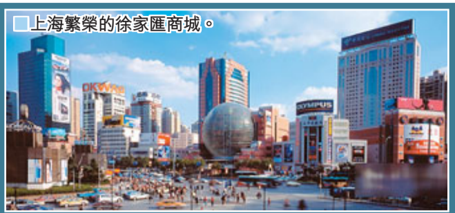
上海繁榮的徐家匯商城。

3月3日，上海徐家匯商城登陸深圳中小板，正式掛牌交易。知名文人余秋雨赫然位列第十大股東，身家輕鬆逾億，一舉成為文壇首富。不過對於余是如何得到股權的爭議亦掀起新一輪高潮。