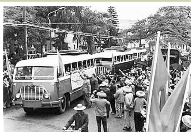
上世紀70年代深圳寶安區的巴士，由「革命委員會」主管。

1961年，寶安縣書記李福林在時任廣東省委第一書記陶鑄的支持下，曾率領全縣開展了一場「利用香港，發展寶安」的大開放運動。當時縣委提出了《關於適當放寬進出口管理意見(草案)》，決定全縣與香港開展小額貿易，開放沿邊22個公社和一個農場，規定出口甘蔗苗、稻草、草皮、河涌雜魚等，以換回鐵鍋、肥料、火柴和煤油等緊缺物資。