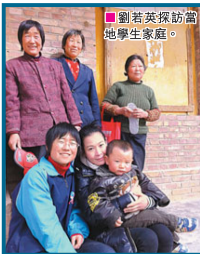
劉若英探訪當地學生家庭。

由浙江新華愛心教育基金會所發起的「珍珠計劃」，主要幫助成績特優但特貧的高中生籌募教育費。劉若英此行是為未來協助募款前往甘肅的珍珠班了解此計劃的情況。她於3月1日抵達，昨日離開。除探訪兩百位珍珠班學生，也深入部分學生家庭，過程中她除透過新浪微博直播，此行也拍攝了紀錄短片作為後續推廣之用。劉若英說：「這次探訪讓我看到希望，知識改變命運。因為透過我們的捐助，能夠有更多孩子獲得受教育的機會，他們的命運未來能有所不同。他們受了教育，未來能成為這個社會的中堅分子，帶來更多人生活的改變。」她正在考慮自己捐贈的額度，未來還會考慮對該基金會針對幼學童的穿衣、飲食資助計劃進行資助。