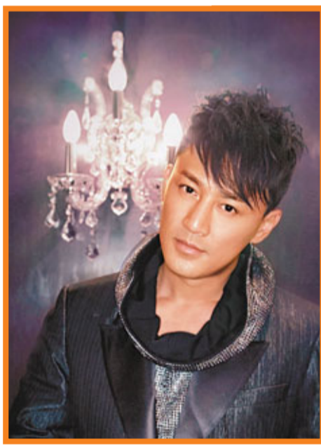
林峯的首張國語專輯將內附一本性感相集。