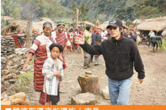
魏德聖導演指導族人演員。

電影《賽德克·巴萊》已確定將於今年9月9日和9月30日，分上下兩集在台灣上映，10月及11月分兩集在香港上映。