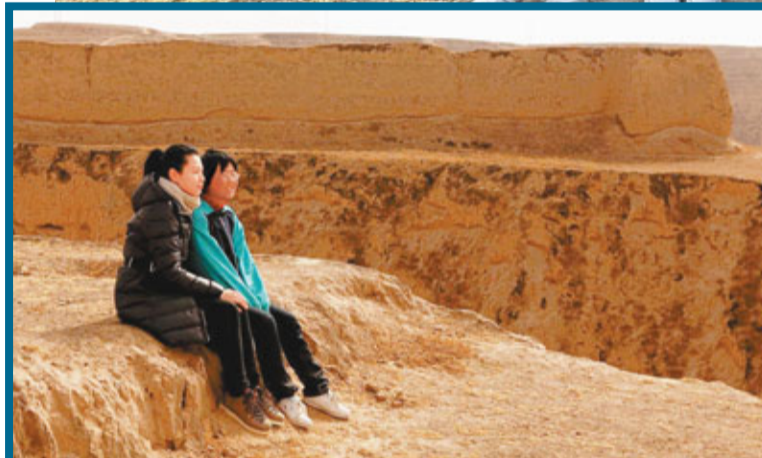
劉若英透過微博，讓更多粉絲能感受到當地的狀況。