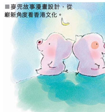
■麥兜故事漫畫設計，從新角度看香港文化。