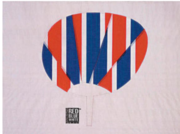
■「又一山人」用紅白藍表現藝術之美無處不在。