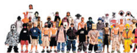
■Michael Lau的街頭藝術人形系列。