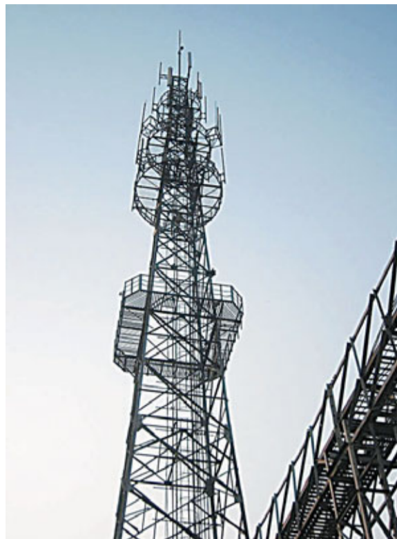
■「系統設計」概念設計出的奧爾泰Super WiFi基站。