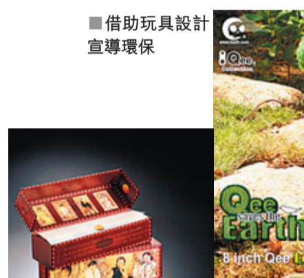
■借助玩具設計宣傳環保