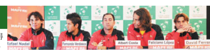
西班牙隊派出豪華陣容出戰戴盃。

港隊集訓大軍共22人，其中12人為廣州亞運及東亞運的代表隊成員，亦有部分青年軍選手，除備戰香港國際七人欖球賽外，亦為下月底的五國欖球賽作好準備，教練戴里斯表示將於本月19日公布最後16名出戰七人欖球賽名單。港隊將於本月25至27日假香港大球場舉行。