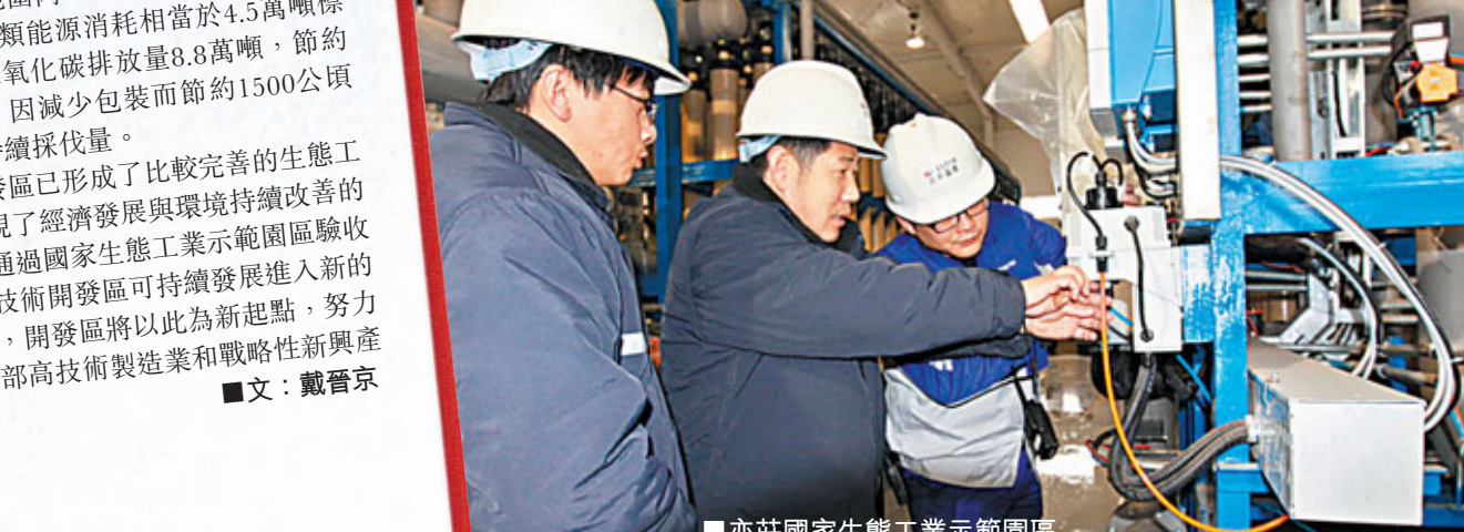
亦莊國家生態工業示範園區。