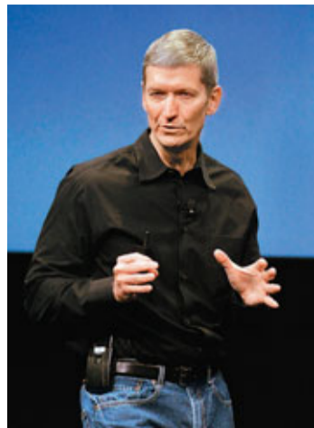
蘋果營運總監庫克的作風較喬布斯低調。