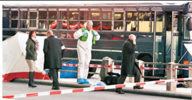
警方調查發生槍擊案的美軍巴士。

德國法蘭克福機場昨日發生槍擊案，機場警方向法新社表示，事發於一架美軍巴士上，造成兩名美軍死亡，另有2人重傷。德國官員稱不排除涉及恐怖主義。