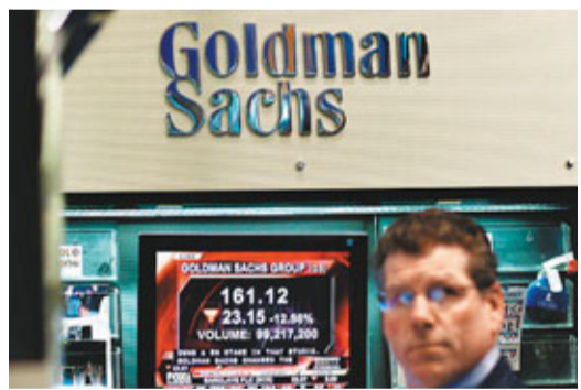
投資銀行高盛去年下半年純利為335億港元。