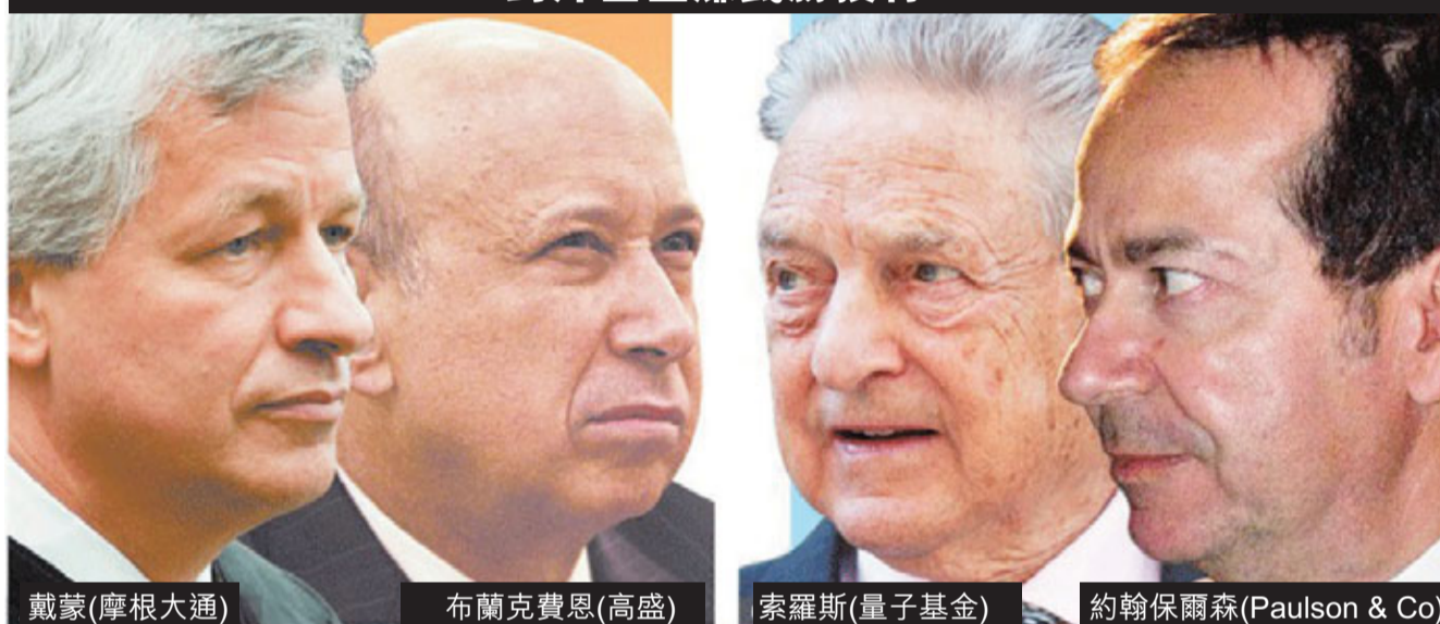
戴蒙(摩根大通) 布蘭克費恩(高盛) 索羅斯(量子基金) 約翰保爾森(Paulson & Co)