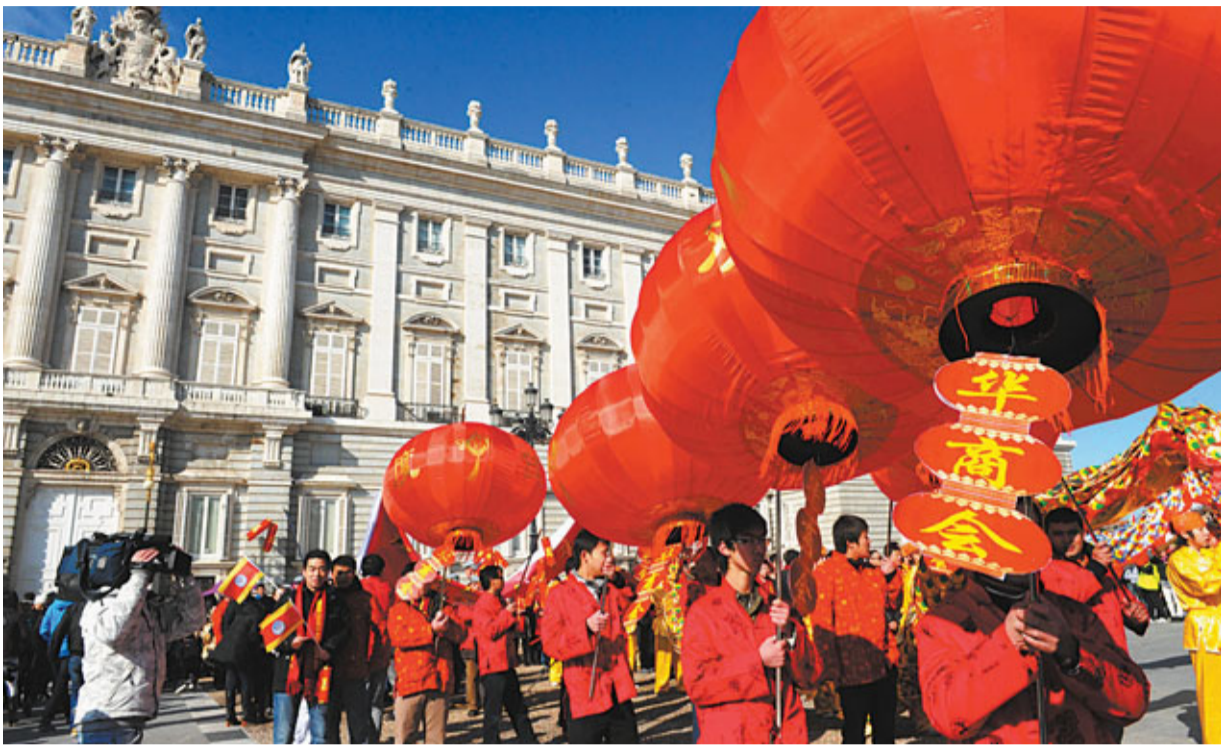
■西班牙對華商展開稅務稽查。圖為西班牙華商會參加春節遊行，手持大紅燈籠從馬德里皇宮前經過。

秘密。比如某商品在中國的出口價格是100元人民幣，出口具的出口價格表則是10元人民幣，在西班牙海關報稅時也以10元的價格報關。如此便宜的價格令西班牙海關覺得不可思議，海關專門派人前往中國實地考察商品價格，才發現被華商蒙騙。