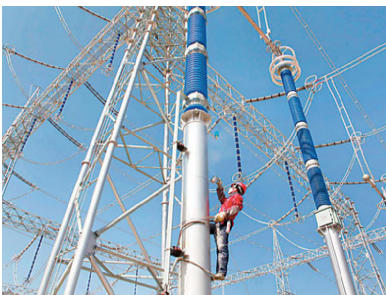
■世界電壓等級最高智能變電站1日在陝北投運。

此外，電動汽車充電換電網絡建設亦納入到智能電網建設規劃中。國家電網副總經理王相勳表示，目前中國充電站及充電樁數量已居世界第一。在「十二五」期間，中國將初步建成覆蓋全國的智能充電換電服務網絡。