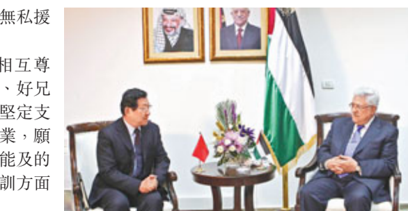
■巴勒斯坦民族權力機構主席馬哈茂德·阿巴斯(右)在約旦河西岸城市拉姆安拉會見來訪的中國商務部部長陳德銘。

阿巴斯說，中國是巴勒斯坦友好國家和真誠的朋友，巴方十分重視發展對華關係，感謝中方對巴勒斯坦人民正義事業的一貫支持，以及長期以來向