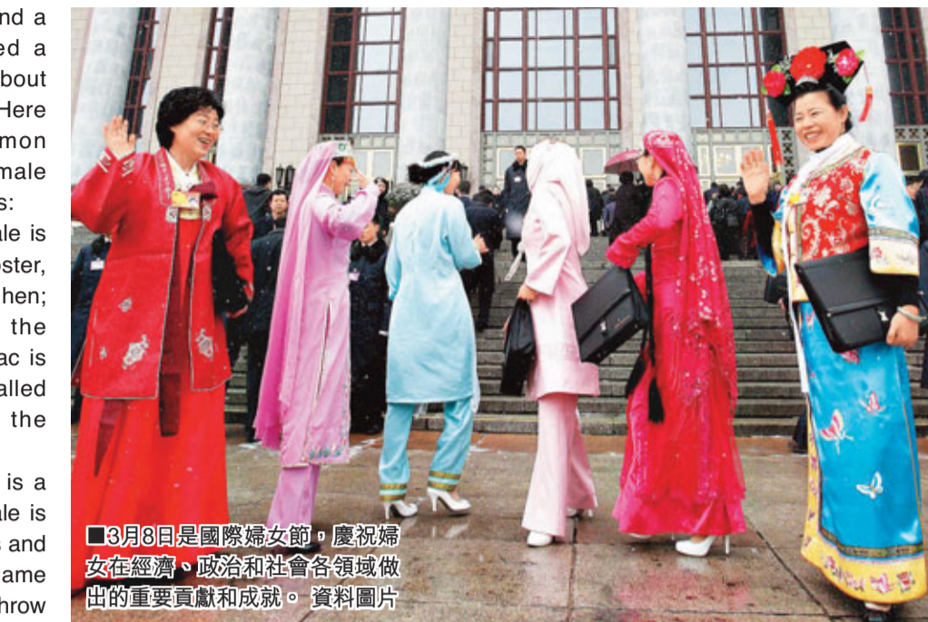
3月8日是國際婦女節,慶祝婦女在經濟、政治和社會各領域做出的重要貢獻和成就。資料圖片

called a 'boy', and a female is called a 'girl'. But how about other animals? Here are some common names for the male and female adults: — chicken: a male is a cock or rooster, a female is a hen; its year in the Chinese zodiac is most often called Year of the Rooster; — duck: a male is a drake, a female is a duck; 'ducks and drakes' is a game in which you throw flat stones so that they move along the surface of water; — goose: a male is a gander, a female is a goose; a 'wild goose chase' is an impossible search that wastes our time; — cat: a male is a tom or tomcat, a female is a queen; — dog: a male is a dog, a female is a bitch; people also use the word 'bitch' to insult a female person; — lion: a male is a lion, a female is a lioness; — tiger: a male is a tiger, a female is a tigress.