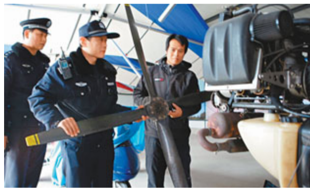
北京警方檢查飛行俱樂部、航模培訓班、航模銷售商店的「兩會」禁飛落實情況。

據中新社28日電 為確保全國「兩會」期間北京上空的絕對安全,北京警方28日宣佈,自3月2日零時起至3月15日24時止,嚴禁一切單位、組織和個人在以天安門廣場為中心的200公里半徑範圍內進行各類體育、娛樂、廣告性飛行活動。