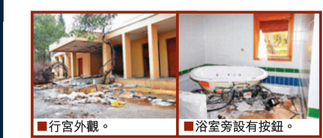
行宮外觀。浴室旁設有按鈕。

英德秘密行動救人 驚險過程如電影 英國繼周六派出特種部隊成功在利比亞「突擊撤僱」後，前天重施故技，派軍機闖進利國沙漠地區，再救出一批滯留公民。德國亦稱在周六派出兩架軍機執行同類任務，救走132人。分析指出，救人行動事前未獲利國批准，顯示西方國家為拯救公民，不再理會利國的領空權。 英國國防大臣霍理林表示，3架英軍飛機前天從利國東部沙漠多處地點，救走150名公民到馬耳他，其中一架軍機輕微受損。一名獲救英國公民憶述，他們在沙漠的機場等了數小時，2架軍機突然出現和降落機場，在英軍指示下，他們隨即趕緊登機，其間一名利比亞民兵衝前，企圖用刀片刺穿飛機輪胎，一名英軍隨即開火制止，驚險過程猶如電影情節。