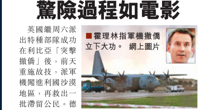
霍理林指軍機撤僱立下大功。