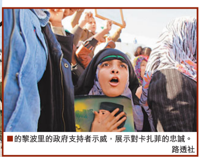
的黎波里的政府支持者示威，展示對卡扎菲的忠誠。

利比亞內戰越演越烈，政府軍和反對派「革命軍」昨日爭奪第3大城市米蘇拉塔的空軍基地，目擊者稱當天早上，一架政府軍機被「革命軍」擊落，示威者擒獲機組人員。反對派再拿下西部多個城鎮，聲稱已奪得80%國土控制權，進一步逼近首都的黎波里。兵臨城下且眾叛親離的領袖卡扎菲前天仍然死撐，堅稱人民仍支持他。效忠卡扎菲的部隊伺機從反對派手中，重奪的黎波里周邊城市，已把在距離首都僅50公里的扎維耶重重包圍，準備反攻。香港凌晨消息，美國國防部發言人拉潘稱，美軍重新調動利比亞周圍的海軍和空軍部隊，以便「一旦作出決定時……能提供更多選擇和大彈性」。