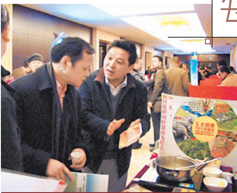
■文教授在向顧客推銷他的「天價」豬肉。

「我們這肉，只用清水煮都香得很。」日前，在長沙一家小店內，一位大學教授在向顧客推銷豬肉。這裡的豬肉比起市場價要高幾倍，最貴甚至高達976元/公斤。