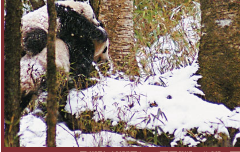
■2月14日，陝西佛坪國家級自然保護區，大熊貓母親背着幼仔在雪地上行走。