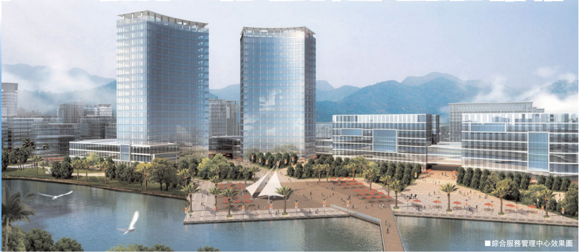
綜合服務管理中心效果圖

龍崗，作為深圳面積最大的一個城區，在深圳推進特區一體化和舉辦大運會之際，作為大運會主場館及大運村所在地，迎來了難得的發展機遇。