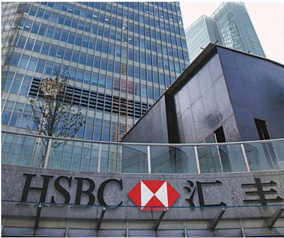
■券商普遍對匯控去年業績感樂觀。

據了解,歐智華個人花紅亦會大減,其09年花紅收入達900萬英鎊,計及薪酬及其他獎金,總值逾1,000萬鎊,屬同年收入最高的一位執行董事,但報道指今次的花紅將減至700萬英鎊。