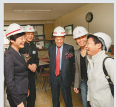
林鄭月娥參觀舊式公屋的模擬單位。她表示,第3期「活化歷史建築伙伴計劃」將於年中前招標。

香港文匯報訊(記者 曾偉龍)被納入第1期「活化歷史建築伙伴計劃」的石硤尾美荷樓,昨日舉行動土儀式,預計於明年下半年「變身」為青年旅舍,提供129間房間。發展局局長林鄭月娥表示,第3期活化計劃獲港府撥款5億元,將於年中前招標。她賣關子說:「其中一個項目是大家期待已久的。」據悉,有關項目是港島司徒拔道45號大宅「景賢里」。