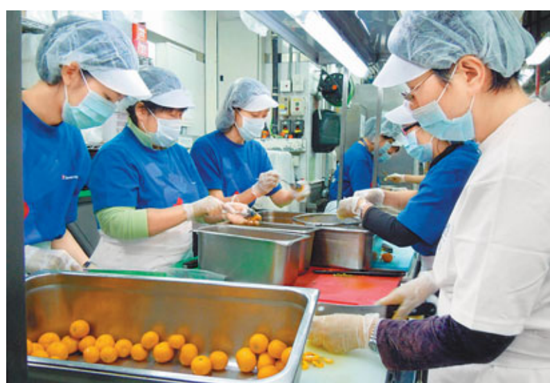
聖雅各福群會用收集回來的年桔製成果醬,明天派發予200多個基層家庭。

另外,眾善坊新春期間向商業大廈收集大批年桔盆栽,製成300個果醬,將於明天派發至200多個接受眾善坊服務的家庭,讓基層兒童也可享受甜食。