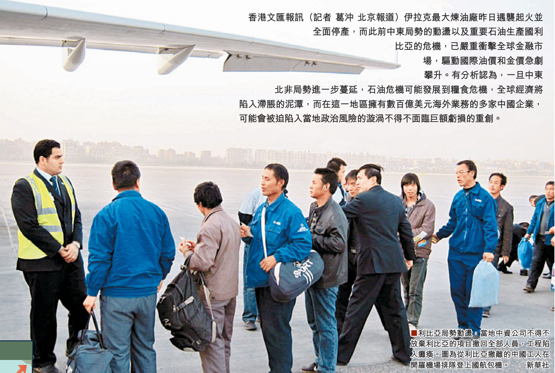
利比亞局勢動盪,當地中資公司不得不放棄利比亞的項目撤回全部人員,工程陷入癱瘓。圖為從利比亞撤離的中國工人在開羅機場排隊登上國航包機。

北非局勢進一步蔓延,石油危機可能發展到糧食危機,全球經濟將陷入滯脹的泥潭,而在這一地區擁有數百億美元海外業務的多家中國企業,可能會被迫陷入當地政治風險的漩渦不得不面臨巨額虧損的重創。