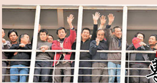
26日,從利比亞撤離的中方人員乘客輪抵達馬耳他,客輪上的中國工人向岸上迎接人員招手。

香港文匯報訊 載有寧波華豐建設股份有限公司在利比亞所有員工的郵輪,在北京時間2月25日15時40分起航,前往馬耳他。26日傍晚,華豐公司員工抵達馬耳他瓦萊塔港。他們將乘坐東航撤僑包機回國,第一批人員預計最早將於今日(27日)下午抵達上海。