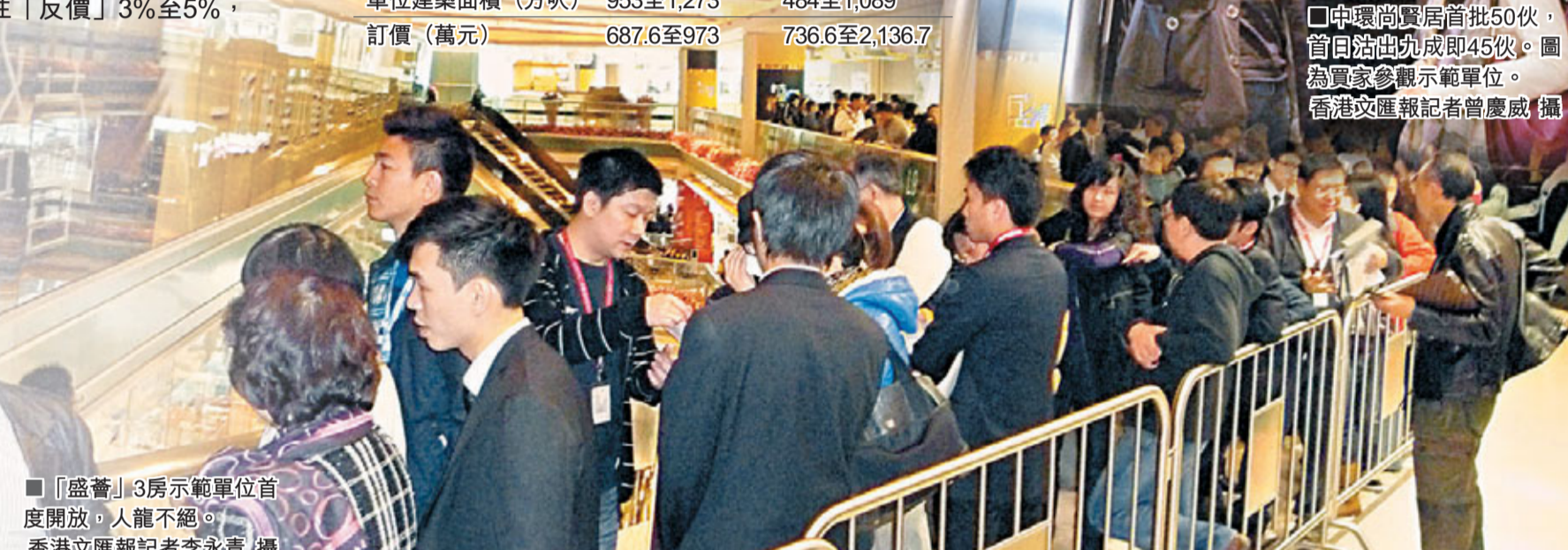
中環尚賢居首批50伙，首日沽出九成即45伙。圖為買家參觀示範單位。