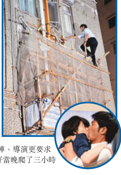
■攀山高手古天樂爬上圓圓四樓的家。

反而談及他拍攝爬入圓圓家後,頭頂便來了個「胸罩八卦陣」這幕戲時,他比較激動:「雖然之前我都拍過同bra有關戲,但今次一嚙掛住咁多個bra,仲要我頭頂係咁俾佢掃,又要俾啲bra纏住,真係覺得有嘞邪,應該要買番啲綠柚葉洗頭水嚟洗吓先得!」但除了他覺得這事情很纏繞之外,他看到劇組所有人也看得非常開心,令他更加唔知好嘍定好笑。