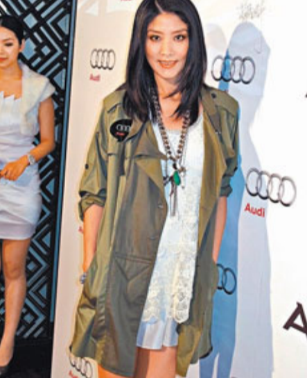
■陳慧琳喜懷有子女。