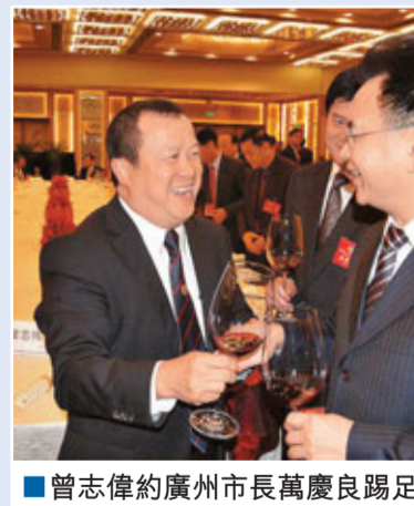
■曾志偉約廣州市長萬慶良踢足球。

香港文匯報訊(記者 沙飛 廣州報道)曾志偉在廣州市領導與港澳委員的座談會上,曾志偉用鄉音問候廣州市長萬慶良,並相約一起踢足球,弘揚體育精神。「你好,萬市長!男子漢,硬打硬。」曾志偉用客家話問候廣州市長萬慶良,不由讓這位來自廣東五華的市長嚇了一跳。萬慶良說,「沒想到你也是五華人,太巧了。」曾志偉告訴香港文匯報記者,他也是廣東五華人,以前從來沒有回去過,這次來廣州開會專門請了一天假回家想探訪。五華鄉親熱情的接待了他,還教會他幾句標準的「五華客家話」。曾志偉表示,自己問候市長的那句話就是剛學會來的。