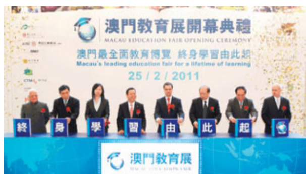
「澳門教育展」展期至2月27日,有意升學者可往探索不一樣的升學道路。