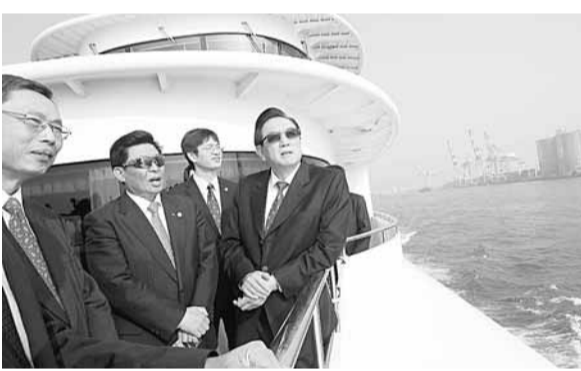
陳雲林(左4)25日上午參觀高雄港，並搭船觀賞港區建設。

滯銷問題。他呼籲兩岸企業一起來解決這個問題，也期望到大陸投資成功的企業，可以回來台灣一起參與，讓雙邊都獲利。