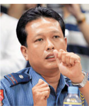
菲特警指揮官柏斯高。