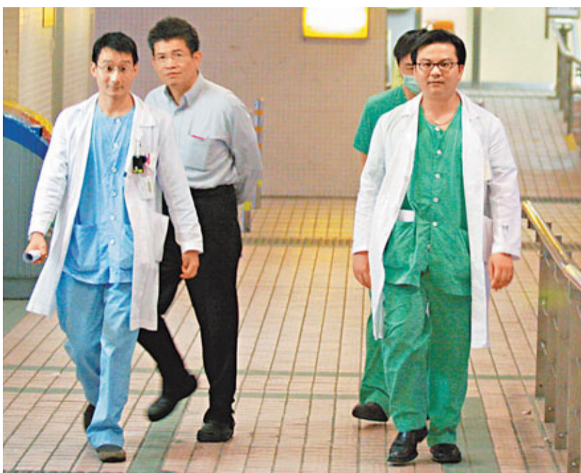
香港經濟好轉，公立醫院醫護人員「跳槽」至私家醫院的情況加劇。資料圖片

醫管局昨日發表聲明，指該局十分關注前線內科醫生沉重的壓力，並將根據前線員工意見，於3星期內敲定改善措施，有關措施的重點包括：目前每年因填補人手流失及開設新服務，平均大約有150個副顧問醫生職位空缺，由駐院醫生晉升填補，該局將於下年度(2011-12)額外增加晉升名額，並會與聯網及醫生工會共同研究各專科的分配比例；針對人手短缺最嚴重的專科部門，協調分配年中新入職醫生名額；重設專科考試費資助；聘請兼職醫生協助處理專科門診病人服務，以特別津貼補償員工的額外工作量和值班，增加文員和24小時抽血室支援醫生的病房工作等。