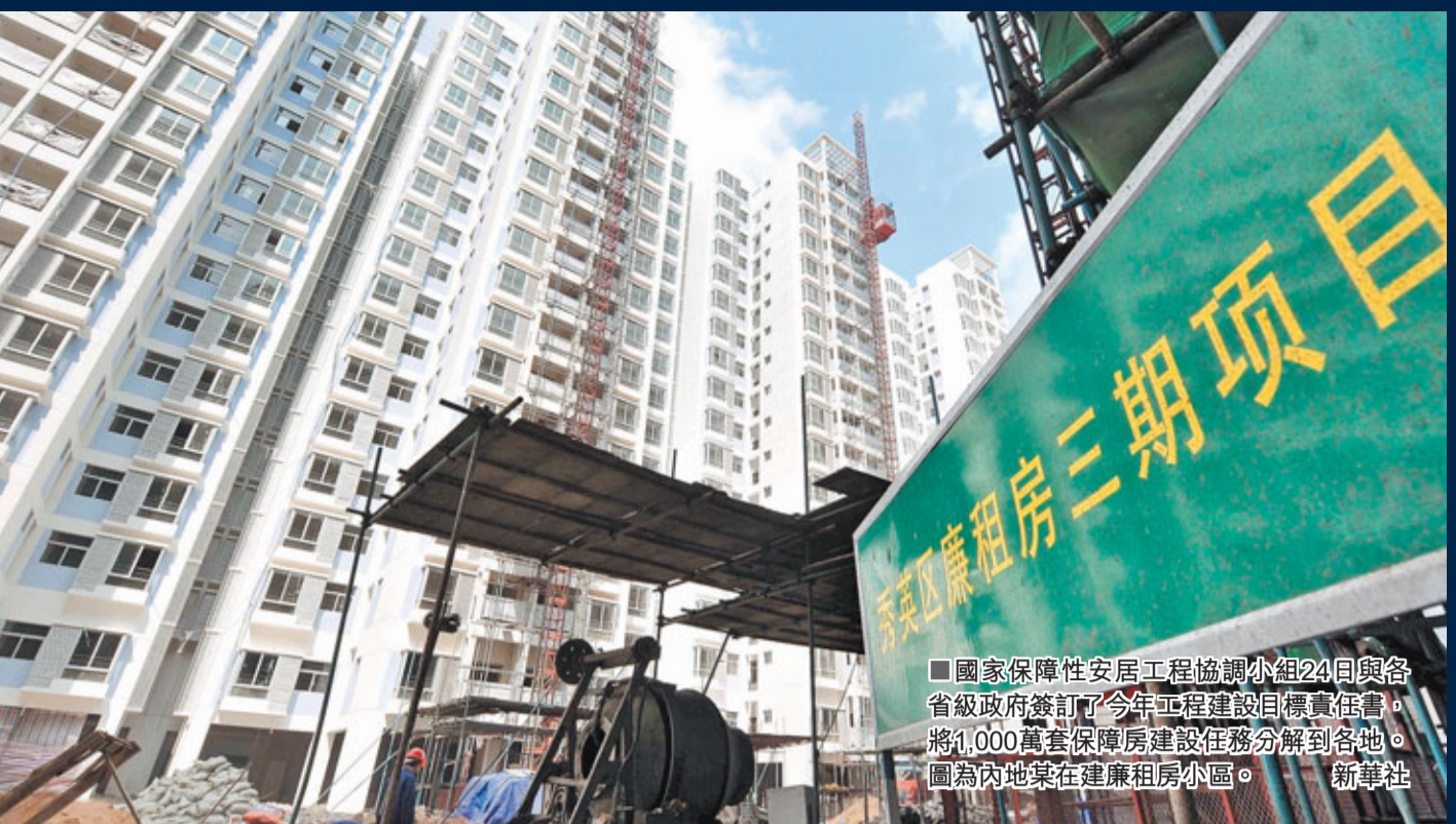
國家保障安居工程協調小組24日與各省級政府簽訂了今年工程建設目標責任書,將1,000萬套保障房建設任務分解到各地。圖為內地某在建廉租房小區。新華社

香港文匯報訊(記者 羅洪嘯 北京報導)全國「兩會」召開在即,不論委員代表還是普通民眾都對「十二五」樓市調控充滿期待,為此中央提前派發千萬套保障房「民生大禮包」。24日,各地政府與國務院保障安居工程協調小組簽訂了2011年的保障安居工程建設目標責任書,今年10月31日前必須動工興建1,000萬套保障房的硬指標,這幾近去年全年商品住房的供應量。這批保障房投入使用後將對平抑樓價,穩定民心具有重要作用。