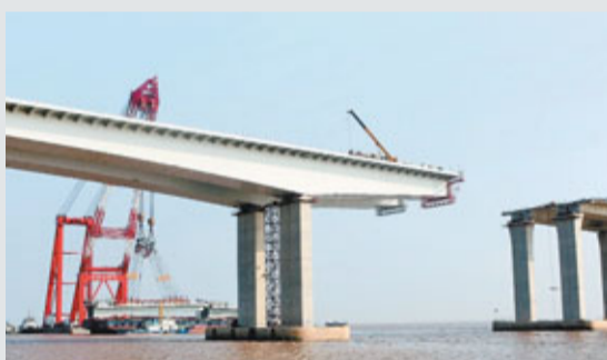
大橋合龍 24日,上海崇(明)啟(東)大橋主跨順利合龍。預計崇啟大橋明年上半年建成通車,屆時,聯合上海長江隧橋,在長江口組成上海經崇明至江蘇啟東的越江快速通道,上海和江蘇將實現1小時互通。新華社

據悉,大陸目前共有台灣省籍全國人大代表23人,台灣省籍全國政協委員39人,他們活躍在大陸的政治舞台。2010年3月「兩會」上,他們提出的建議、提案123件,其中近5成涉及兩岸事務。