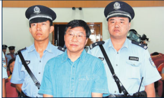
調查報告指,內地超過九成地廳及司局級官員中認為應當公開財產。圖為有「草原巨賄」之稱的內蒙古赤峰市原市長徐國元早前在包頭市中級人民法院接受一審宣判。資料圖片

研究者認為,這與近年來中國腐敗行為日益隱蔽化、個別腐敗分子通過親屬轉移財產、逃避處罰有著密切的關係,公眾更關心的是成年子女利用父母的權力去謀私。