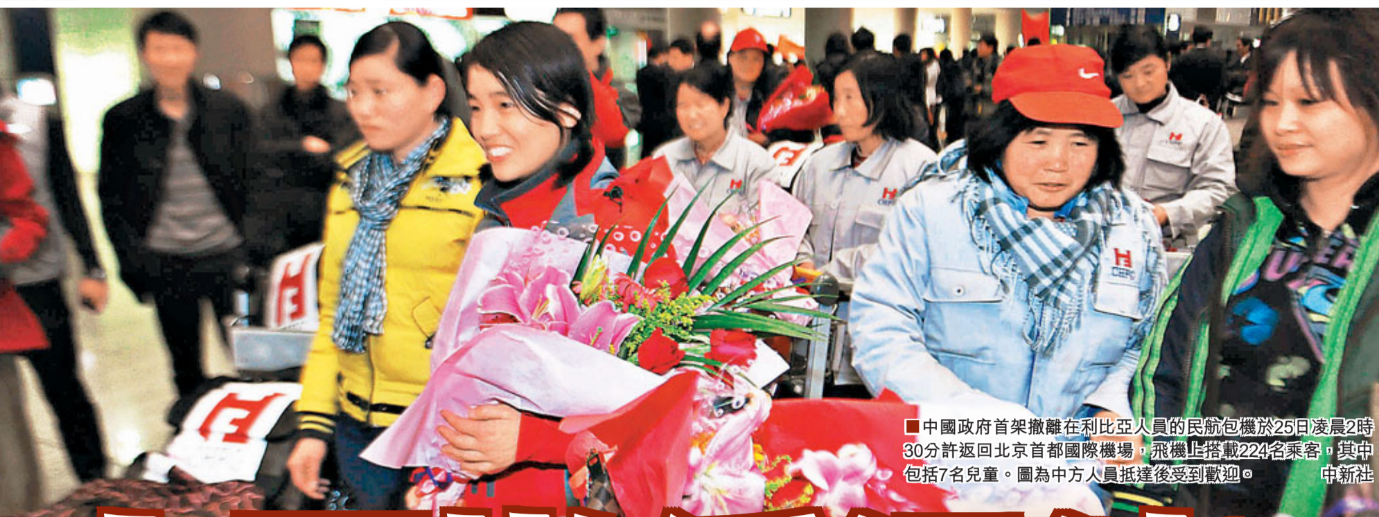
中國政府首架撤離在利比亞人員的民航包機於25日凌晨2時30分許返回北京首都國際機場,飛機上搭載224名乘客,其中包括7名兒童。圖為中方人員抵達後受到歡迎。