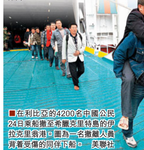
在利比亞的4200名中國公民24日乘船撤至希臘克里特島的伊拉克里翁港。圖為一名撤離人員背着受傷的同伴下船。

此外,特別值得一提的是,中國海軍第七批護航編隊「徐州」號導彈護衛艦日前已啟程趕赴利比亞附近海域,為撤離在利中方人員提供保護。中國國防大學教授紀明葵少將向媒體指出,隨着非傳統安全領域的軍事鬥爭不斷加強,軍隊負有了執行海外保護海外人民利益的任務。他說,隨着時間的推移,隨着軍隊任務的拓展,中國軍隊不但會以軍艦撤僑,還會以其他方式完成中國海外利益的需求。