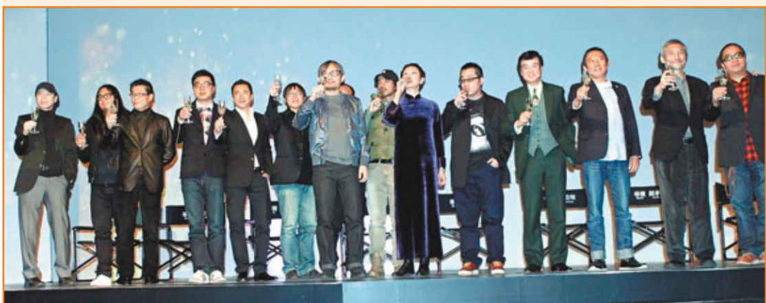
這個兩岸三地導演和監製陣容，均要為華誼兄弟公司大展拳腳。

總裁王中磊表示：今年華誼兄弟十部重頭大片將由夏永康、陳國輝、林書宇、烏爾善、馮德倫、鈕承澤、彭浩翔、于仁泰、成龍、徐克、馮小剛等11位來自兩岸三地的優秀導演掌舵，希望為華語電影帶來一次新浪潮。其中有取材幾米漫畫，散發青春片的清新气息的《星空》；都市愛情喜劇《會撒嬌的女人最好命》；台灣導演鈕承澤導演要透過一些故事，跟世界分享何謂真正的愛，將開拍《LOVE》；夏永康、陳國輝導演的《全球熱戀》；烏爾善導演的《畫皮2》；徐克導演、施南生監製《狄仁傑前傳》；成龍導演、唐季禮監製的《十二生肖》；馮德倫導演、李連杰監製的《太極》；于仁泰執導、黃百鳴監製的《楊家將》，于仁泰稱是激烈得令人無暇喘息的新一代戰爭電影。總括來講，華誼兄弟今年拍製的影片題材保持多元化。