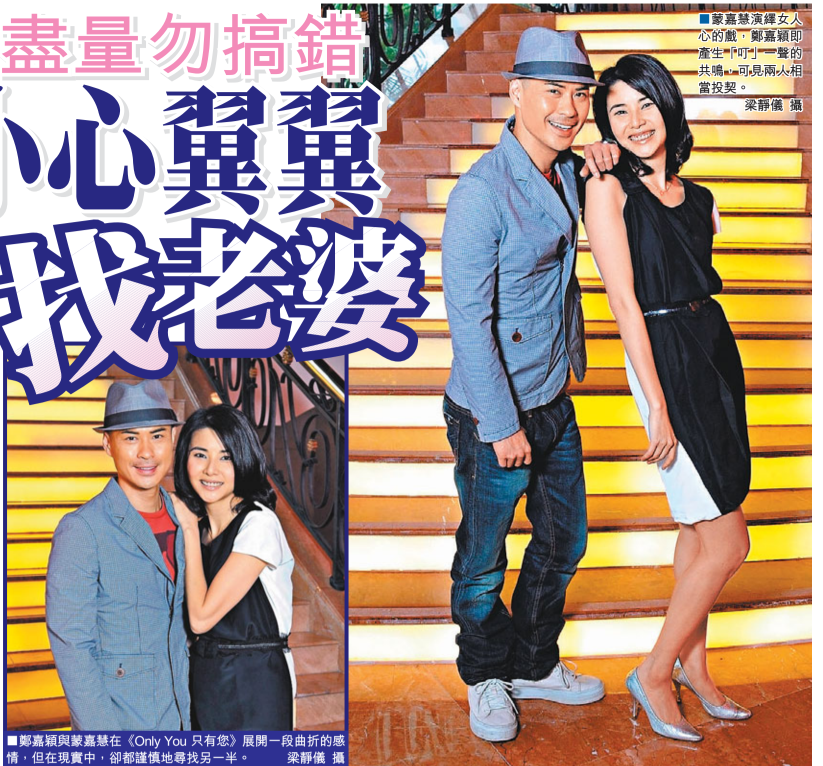
鄭嘉穎與蒙嘉慧在《Only You 只有您》展開一段曲折的感情，但在現實中，卻都謹慎地尋找另一半。 梁靜儀攝

蒙嘉慧演繹女人心的戲，鄭嘉穎即產生「叮」一聲的共鳴，可見兩人相當投契。 梁靜儀攝