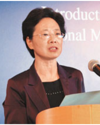
■舟山市委書記梁黎明表示，舟山期待與香港客商進行更深層次的合作。

香港文匯報訊(記者 白林森)浙江省舟山市昨日在香港尖沙咀洲際酒店舉行舟山國家級海洋綜合開發試驗區投資環境說明會，以期學習借鑒香港發展經驗，增進港人對於舟山的認識和了解，促使包括港商、港資在內的海外客商在舟山大力推進海洋綜合開發試驗區的投資開發中實現互利共贏。會上，舟山市委書記梁黎明指出，香港是舟山重要的投資來源地，舟山期待着與港商、港資進行更深層次、更寬領域的合作，特別是港口物流、現代服務業等方面。今後，舟山將每年定期或不定期地在港舉辦一些活動，促進舟山與香港兩地達成更多的共識與合作。