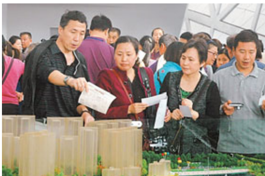
穗樓市出現趕政策「末班車」的情形,近期成交上升。

香港文匯報訊(記者 古寧 廣州報道 劉曉靜 北京報道)廣州新「國八條」落地細則日內將正式出台,當地樓市出現「爭趕末班車」的情形。數據顯示,上周廣州一手住宅成交量急速上漲,尤其是明確被納入限購範圍的從化和增城,上一周成交量漲幅分別達591%、120%。