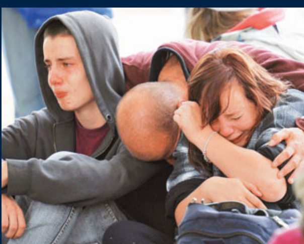
■兩名年輕人得知母親遇難後，悲痛不已。