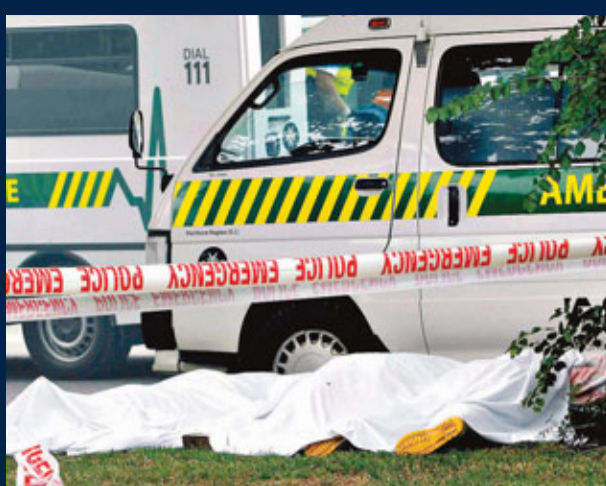
■遇難者屍體停放在路邊。