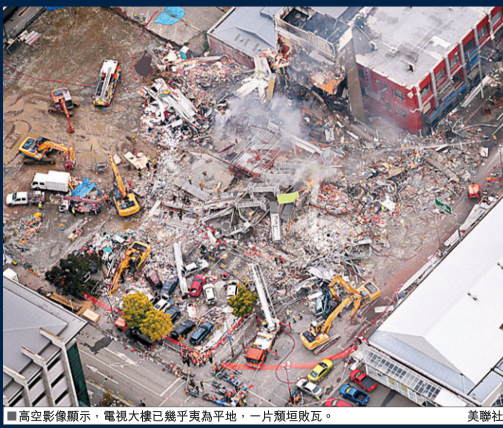
■高空影像顯示，電視大樓已幾乎夷為平地，一片頹垣敗瓦。