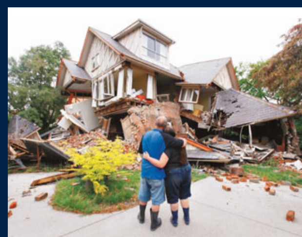
■災民無奈地看着被毀家園。