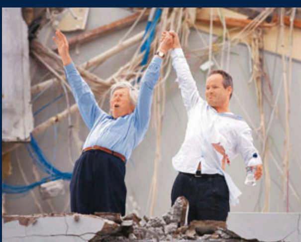
■兩名獲救者攜手歡呼。