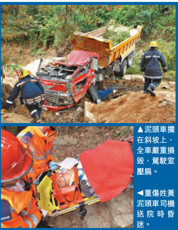
▲泥頭車擱在斜坡上，全車嚴重損毀，駕駛室壓扁。 ▼重傷姓黃泥頭車司機送院時昏迷。