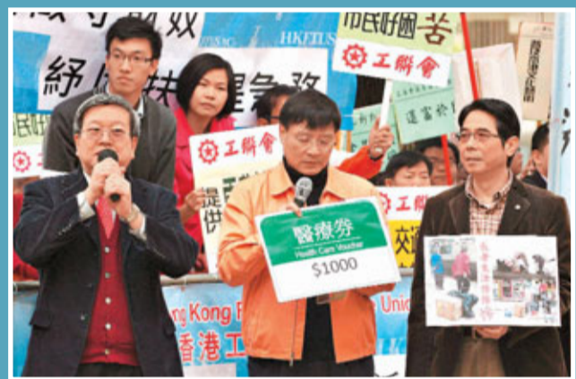
財政預算案出籠，工聯會約70人於立法會門外請願，要求政府增撥資源助基層。