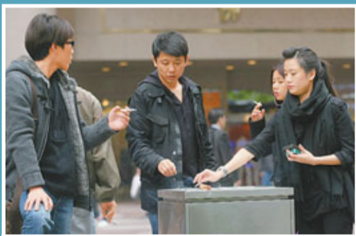
■煙草稅大幅增加，但不少煙民仍表示不會戒煙。