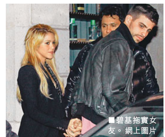
碧基拖妻女友。

毫升左右的血液，通過一種特殊的離心裝置，分離出城陀華迪斯血液內的三種不同物質，然後再將富含血小板生長因子的部分注射到城陀華迪斯的左膝傷處，以幫助他盡快恢復健康。 ■梁啟剛