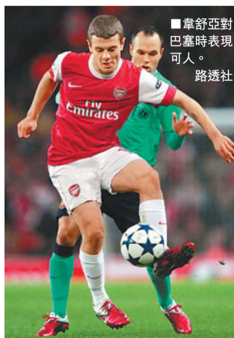
韋舒亞對巴塞時表現可人。