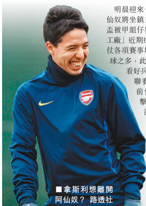
拿斯利想離開阿仙奴？

明晨迎來一場英超補賽，爭標分子阿仙奴將坐鎮主場對陣史篤城。雖然足總盃被甲組仔奧連特迫和需重賽，但「兵工廠」近期進攻發揮依然可圈可點，近6仗各項賽事場場皆有進賬，總共攻入13球之多，此番面對不擅作客的史篤城，看好兵工廠主場稱雄。史篤城近期聯賽發揮剛剛相反，尤其是目前慘遭聯賽作客四連敗的打擊，球隊近3輪聯賽作客更加沒有進賬。