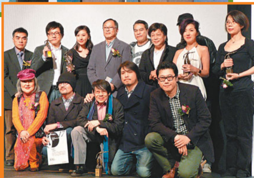
「第十七屆香港電影評論學會大獎」昨日在香港電影資料館舉行頒獎禮。