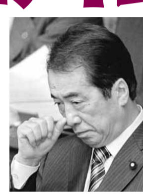
■菅直人面臨巨大政治壓力，經濟改革方案難以出臺。