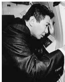
■日本外相前原誠司早前空中視察北方四島。

俄羅斯負責亞太事務的副外長博羅達夫金，召見了美國駐俄大使貝爾勒，就日俄爭議領土問題進行協商。美國國務院早前表明在北方四島(俄稱南千島群島)爭議上支持日本立場的發言，對此博羅達夫金闡述了關於俄方對領土主權的「原則性不變立場」。 早前傳出中國企業將與俄國企業聯手，參與開發北方四島，引起日本不滿。俄總統駐遠東聯邦區全權代表伊