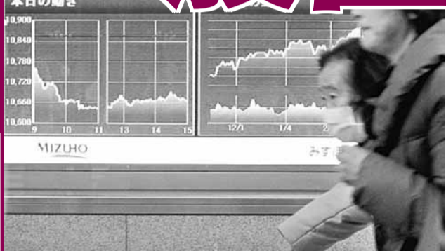
■日經指數昨日跌近200點。