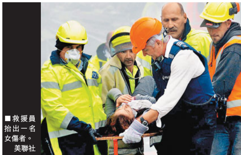
■救援員抬出一名女傷者。美聯社

■法新社/《悉尼先驅晨報》/news.msn.co.nz網站/stuff.co.nz網站