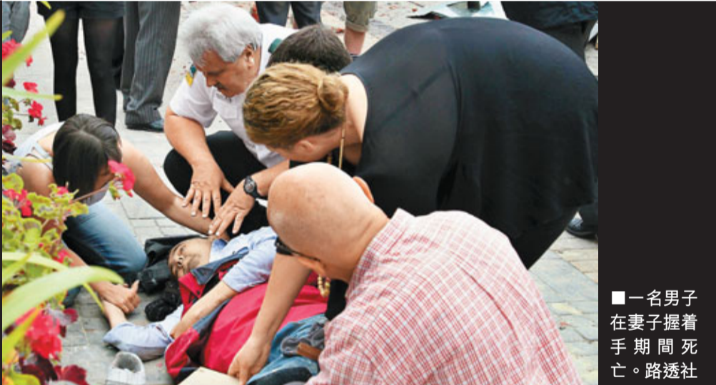
■一名男子在妻子握着手期間死亡。