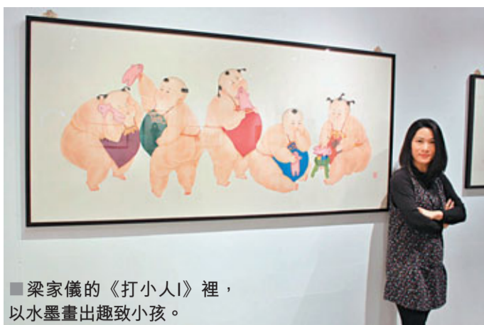
梁家儀的《打小人》裡，以水墨畫出趣致小孩。