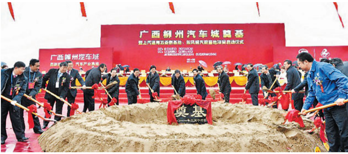
柳州汽車城坐落柳東新區，規劃建設八大功能區域。圖為廣西柳州汽車城奠基儀式現場。

柳州汽車城基地將帶動廣西乘用車零件的發展，吸引全球有實力的零件供應商來這裡佈局。在汽車城奠基儀式前，還舉行了首批進入汽車城的30多個零件項目簽約儀式，總投資達到120億元，計劃建成年產100萬套內外飾件、電器件、底盤件、鈑金件等各類汽車零部