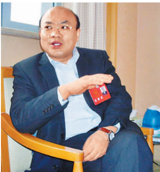
山東省蒼山縣縣長王曉軍。

香港文匯報訊（記者 孫吉成、張璐 濟南報道）正在參加山東省兩會的山東省蒼山縣縣長王曉軍在接受香港文匯報記者專訪時表示，蒼山縣作為中國知名蔬菜大縣與山東蔬菜供港基地之一，十分重視並看好香港市場的廣闊前景。他表示，未來將與香港保持持續經濟文化交流，並將從今年起大力培育優勢企業，爭取選取三四家龍頭企業赴港上市。