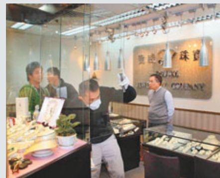
■鑑證科探員替遭賊人搶劫店舖的窗櫺套指模取證，店東(右)正講述遇劫經過。

香港汽車高級駕駛協會主席蒙海強亦曾表示，有部分年長職業司機為了生計，往往不理自己病情有危險，仍哀求醫生「放他一馬」，故醫生必須保持專業判斷，否則可能引發更多事故或嚴重車禍，殃及無辜。