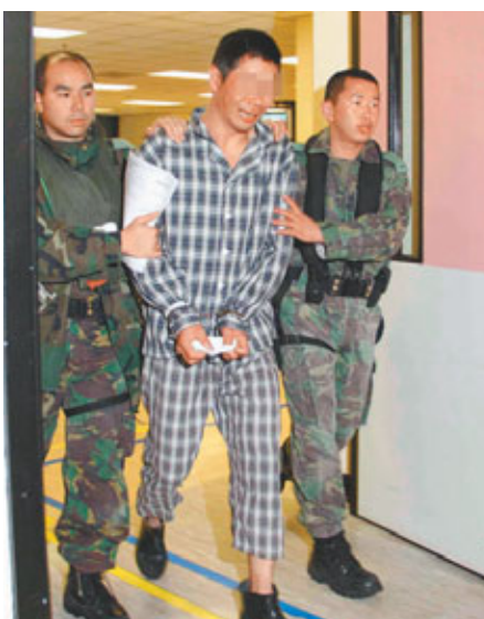
■被捕疑人疑受驚及不適，送院時流下男兒淚。

近年內地經濟騰飛，對飲食講究，海產需求大，尤其是海膽有價有市，不少內地人看準市場需要，偷偷來港捕撈或搜刮本港海產，經兩地警方嚴加取締後一度減少。本港西貢、南丫島、長洲、塔門及東平洲一帶海域是海膽盛產地，內地沿岸海域原也產量甚豐，但在瘋採