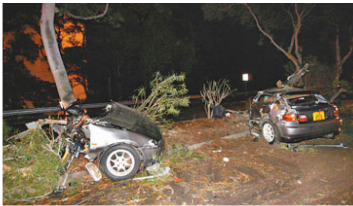
■肇事私家車撞樹後斷成兩截。

事發於昨凌晨零時許，胡駕駛私家車沿屯門龍門路往屯門碼頭方向行駛，途至龍門路輕鐵青山村站對開時，私家車失控剷上路上石壘花槽及攔腰撞向一棵大樹，車身應聲攔腰斷開，組件四散馬路上，車頭一截向前衝約10米，後座女乘客被拋出車外，司機及男乘客受傷被困車內，途經駕駛