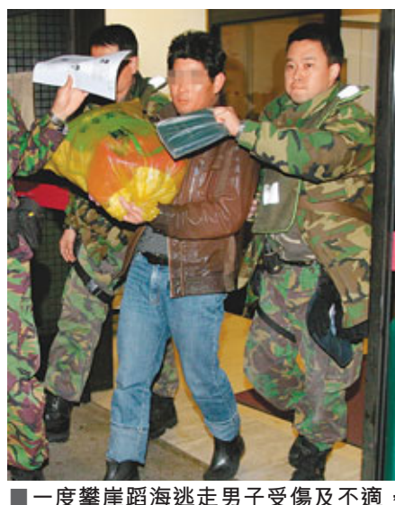
■一度攀崖蹈海逃走男子受傷及不適，被捕後送院救治。

海膽味鹹、性平，營養豐富，外殼布滿尖刺，可食部分為黃色的海膽卵巢，海膽卵含極高脂肪酸，可預防心血管疾病，降