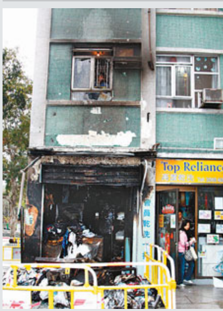
■洗衣店發生火警，波及樓上單位外牆亦被熏黑。

香港文匯報訊(記者 杜法祖)沙田第一城與筲箕灣2間商店，昨晨先後發生火警，其中在沙田第一城一間連鎖洗衣店，昨晨營業期間疑因石油氣漏氣冒煙起火，幸女職員及時逃出店外，消防員到場迅將火勢撲滅，惟全店已付諸一炬嚴重焚毀，店內大批顧客交來衣物受損，消防員搬走店內石油氣樽調查起火原因，火警中幸無人受傷。在筲箕灣東大街，一間漢堡包店昨晨亦發生火警，一名女店員企圖自行救火吸入濃煙不適，須送院救治。