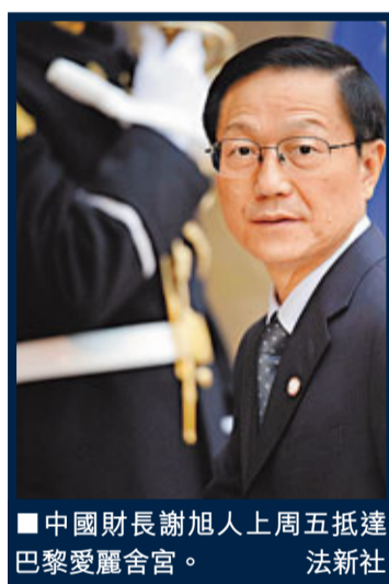
■中國財長謝旭人上週五抵達巴黎愛麗舍宮。

中國財長謝旭人強調，各國應加強國際經濟政策協調，保持主要儲備貨幣匯率穩定，減少國際資本套利流動，防範全球性通脹風險。他說，中國政府今年將採取積極財政政策和穩健貨幣政策，堅持把經濟結構調整作為加快經濟轉型的主要方向，促進經濟增長向消費、投