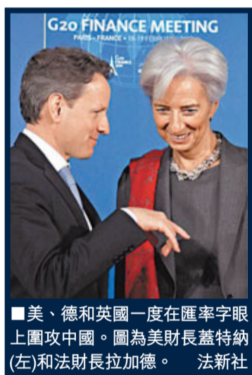
■美、德和英國一度在匯率字眼上圍攻中國。圖為美財長蓋特納(左)和法財長拉加德。

資、出口轉型。與會代表均強調是次聲明是妥協的成果，俄羅斯副財長潘金說：「沒有人完全滿意，所有國家都有點不滿，這是妥協的結果。」美國財長蓋特納則重申人民幣幣值被低估，又說外匯儲備收益問題現階段不算關鍵。