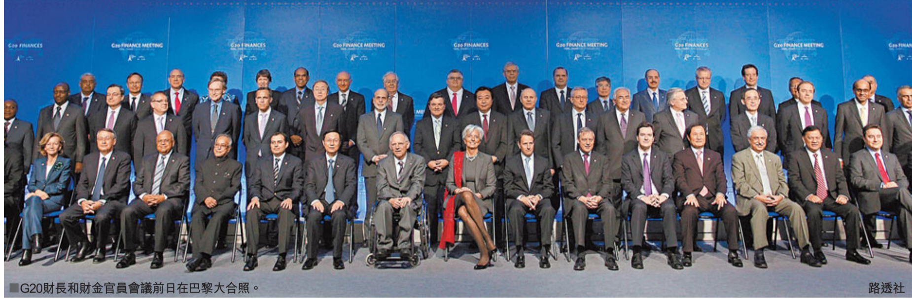
■G20財長和財金官員會議前日在巴黎大合照。