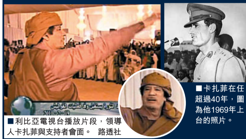
■利比亞電視台播放片段，領導人卡扎菲與支持者會面。