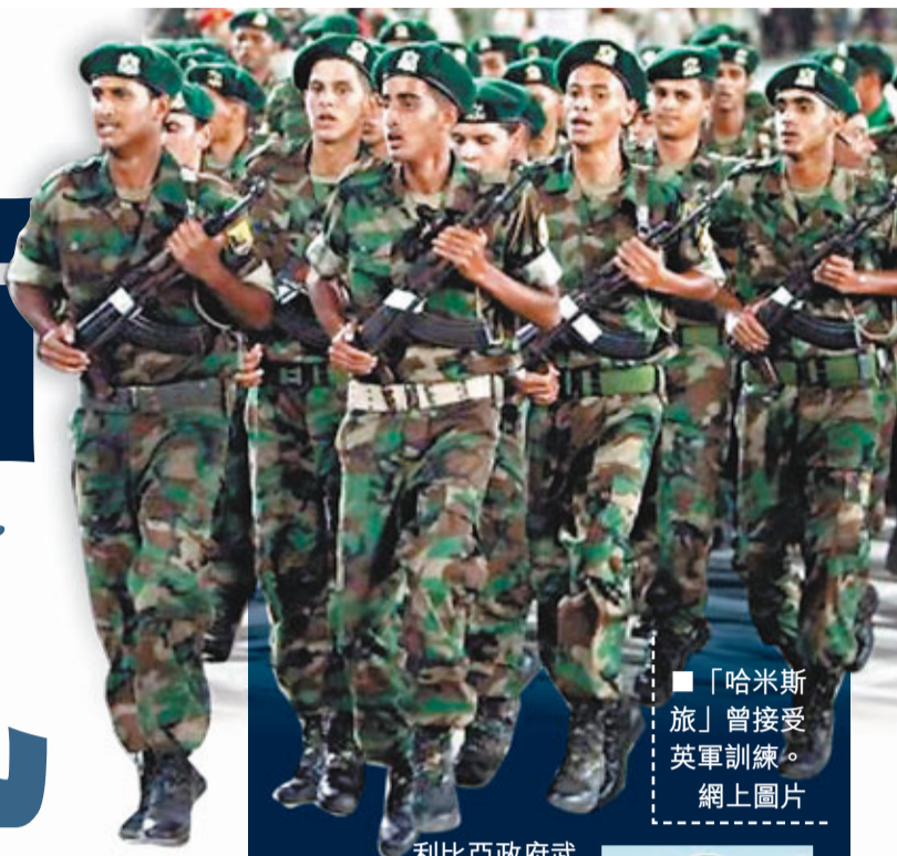
■「哈米斯旅」曾接受英軍訓練。

利比亞當局繼續鎮壓示威行動，在第2大城市班加西，數萬人日前被槍殺示威者的喪禮後，保安部隊向人群開槍。據消息指，估計連日鎮壓已導致近400人喪生。據稱，示威者已佔據班加西和另一東部城市，利比亞領導人卡扎菲派遣多名親兒前往清剿反對勢力，但其中一名兒子反被示威者圍困。