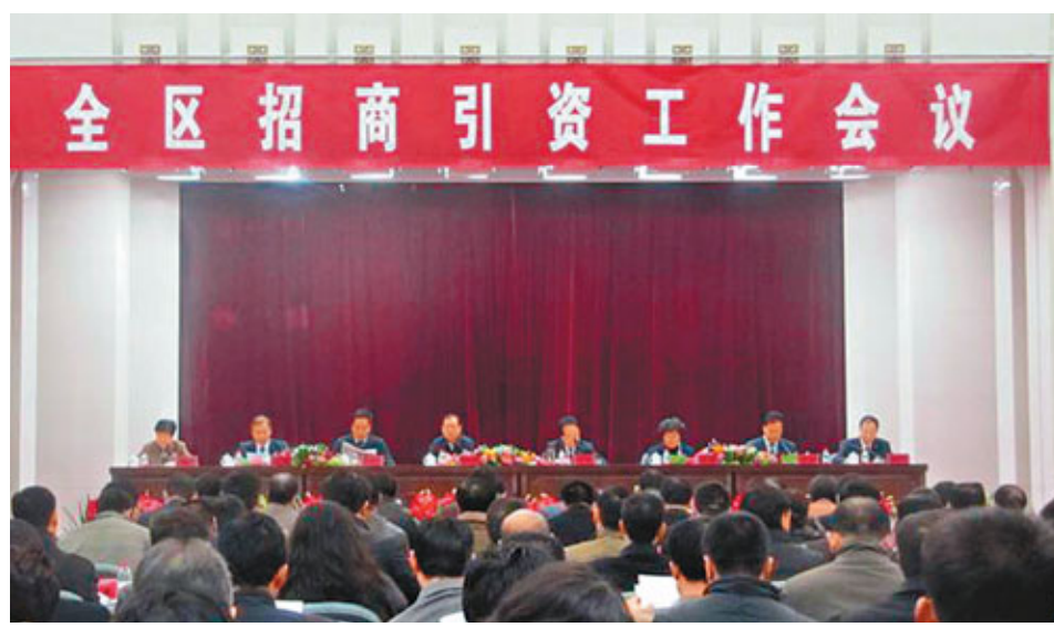
寧夏擬定今年「香港經貿文化旅遊活動周」期間招商引資破千億。

據了解,寧夏「十二五」除了將長三角、泛珠三角、東南亞和港澳台等地區作為重點招商區域以外,還將目標瞄準了中東阿拉伯市場以及海外對口合作領域。寧夏與阿拉伯國家有着相同的文化氛圍以及