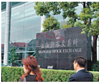
上交所正積極制定備兌股證相關規則。

最好的入市時機。他認為,今年首季內地經濟呈現高通脹的態勢,有人甚至擔心會失控,但通脹處於5%以上的水平是不可能持續的,正常的通脹水平應該在4%左右,所以下半年通脹水平將會往下走。