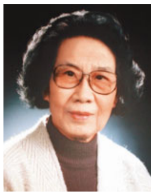
著名越劇表演藝術家袁雪芬19日在滬病逝，享年89歲。資料圖片

據華社19日電 從上海越劇院獲悉，著名越劇表演藝術家、上海越劇院名譽院長袁雪芬於19日下午2時在滬病逝，享年89歲。