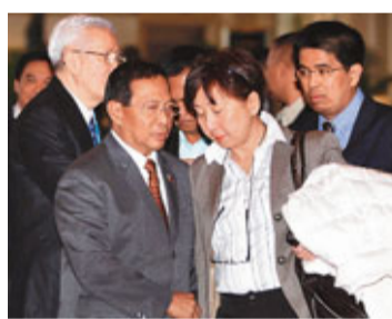
菲律賓副總統畢乃18日抵京，在下榻酒店與一名官方職員商談。

香港文匯報訊（記者 房廈 北京報道）菲律賓政府18日深夜在其外交部網站張貼聲明宣佈，中國當局決定在「法律範圍之內」推遲3名菲籍毒犯處決時間，菲律賓政府對中方的決定表示「誠摯感謝」。北京專家指出，中方做此決定是出於法律事實方面的考量，不可能僅因菲方單純「求情」就接受。中國外交部發言人馬朝旭則回應，這是一起孤立的刑事案件，未來中方願意繼續與菲方保持溝通。